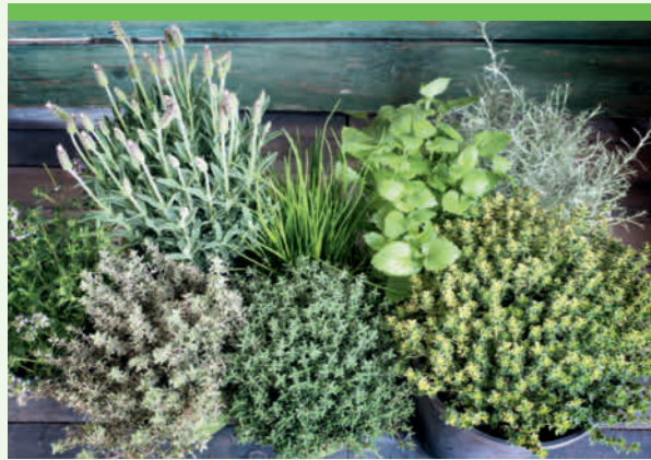
Thymian und Pfefferminze sind nur einige der vielen Kräuter und Pflanzen mit wohltuender oder heilender Wirkung

Die Natur hält vieles bereit, was dem Menschen guttut. Heilpflanzen, Kräuter oder hochwertige Öle und Harze haben jeweils ganz besondere Eigenschaften – einige wirken desinfizierend, andere beugen Entzündungen vor, weitere Pflanzen wirken beispielsweise erfrischend.