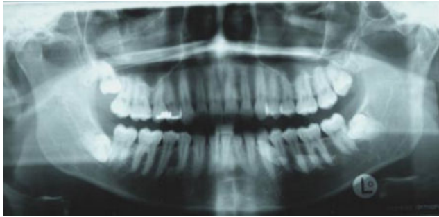
Panoramaschichtaufnahme mit zwei großen Speichelsteinen im linken Wharton'schen Gang der Gl. Submandibularis