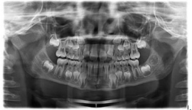
Panoramaschichtaufnahme eines Wechselgebisses mit einer (seltene) medianen Unterkieferfraktur