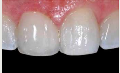
Klinischer Fall, vor und nach der Restauration mit BEAUTIFIL II Enamel