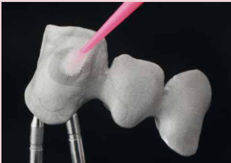
SHOFU MZ Primer Plus