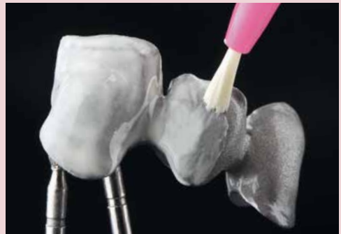
SHOFU Universal Pre-Opaker