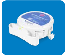
SmartWay Kasette 7805