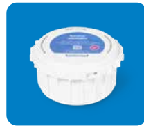
SmartWay Combi 7110

Bitte die Gesamtzahl Ihres abzuholenden Behältertyps eintragen*. Austauschbehälter erhalten Sie in entsprechender Stückzahl zurück.