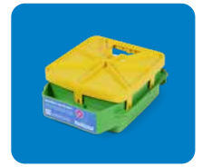
SmartWay Kasette 7800