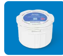
SmartWay Combi 7117